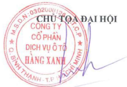
TRẦN QUỐC HẢI